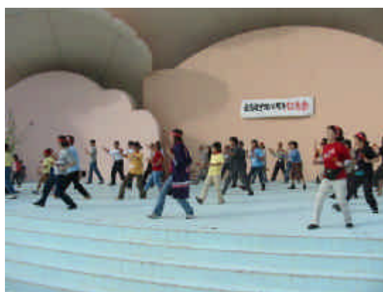
全員!! よさこい踊り