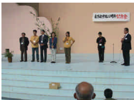
自然遊学館スタッフ紹介

遊学館の10年の意味がちょっぴりわかったような気がしました。 そして今日、私たちもまた遊学館で、明日への元気を頂いて帰りました。