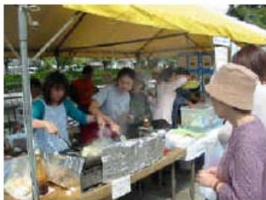
(近畿水の塾「みんなの焼きそば屋さん」はみんなの応援に支えられて…)