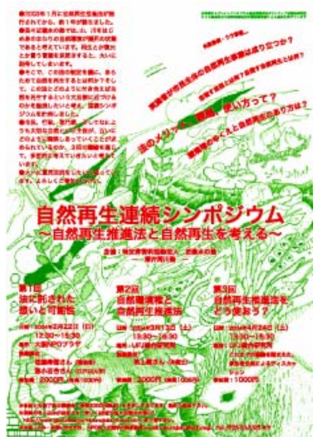
シンポ案内チラシ（下村泰史氏作）

平成 15 年 1 月に「自然再生推進法」施行されたことから、本法を知り、自然再生について考える場として、連続シリーズのシンポジウムを開催した。第 1 回は、「法に託した想いと可能性」、第 2 回は、「自然環境権と自然再生推進法」と題して、講演及び、延べ約 85 名の参加者と活発な意見交換が実施された。