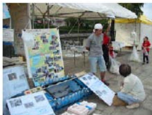
(展示コーナーで近畿水の塾の活動紹介)

内容：水の塾の紹介展示、環境学習講座の実施、手作りボート競走への参加、焼きそば屋の出店を行った。水の塾の活動が十分アピールできた。環境学習講座については、今後検討の余地があり、水の塾の事業の一つとして、試行錯誤しながら継続していく予定。