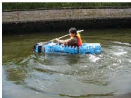
がんばれ！水の塾号

本交流会の実行委員会として参画した。近畿地域での流域内・流域間の連携、交流を深めることができた。また、近畿水の塾においては、会員間、他団体との交流ができた。