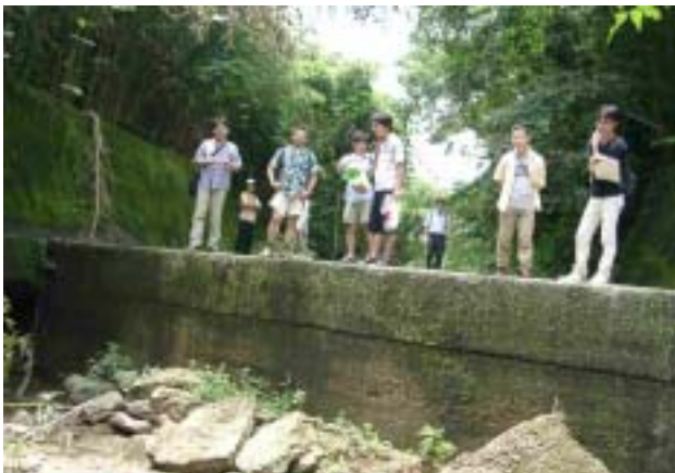
写真：2003.7.21 京都府精華町 煤谷川にて

2000.11.30を第1回とし、2004.3.17の定例会で第39回を迎えた。受講生は、学生・行政担当者・コンサルタント・市民など会員及びその紹介を受けたもので、2000、2001年は河川の基礎工学シリーズ、特別フィールドシリーズ(ワーキング)、2002年はマイリバーシリーズ、2003年は河川関連法(自然再生から淀川を例とした河川整備計画)を中心に展開した。